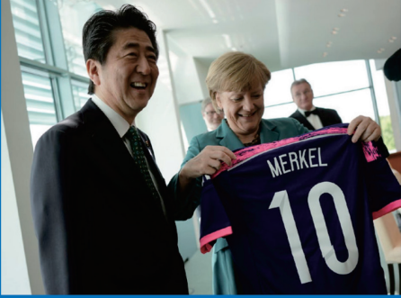
地球儀を俯瞰する外交