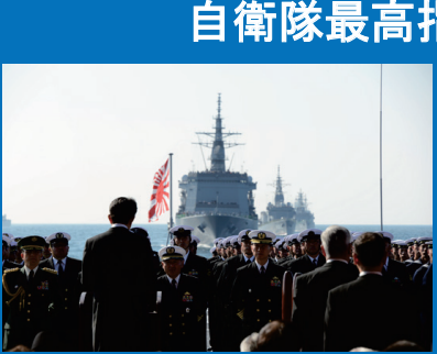
自衛隊最高指揮官として