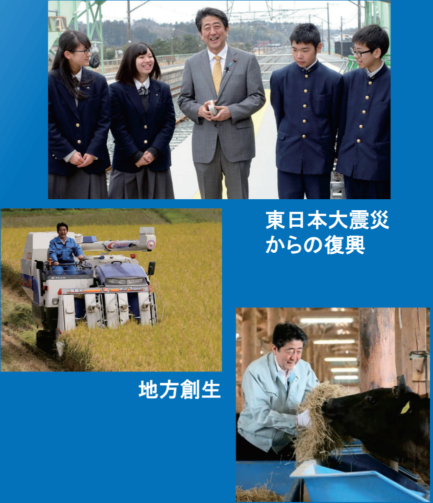
東日本大震災 からの復興