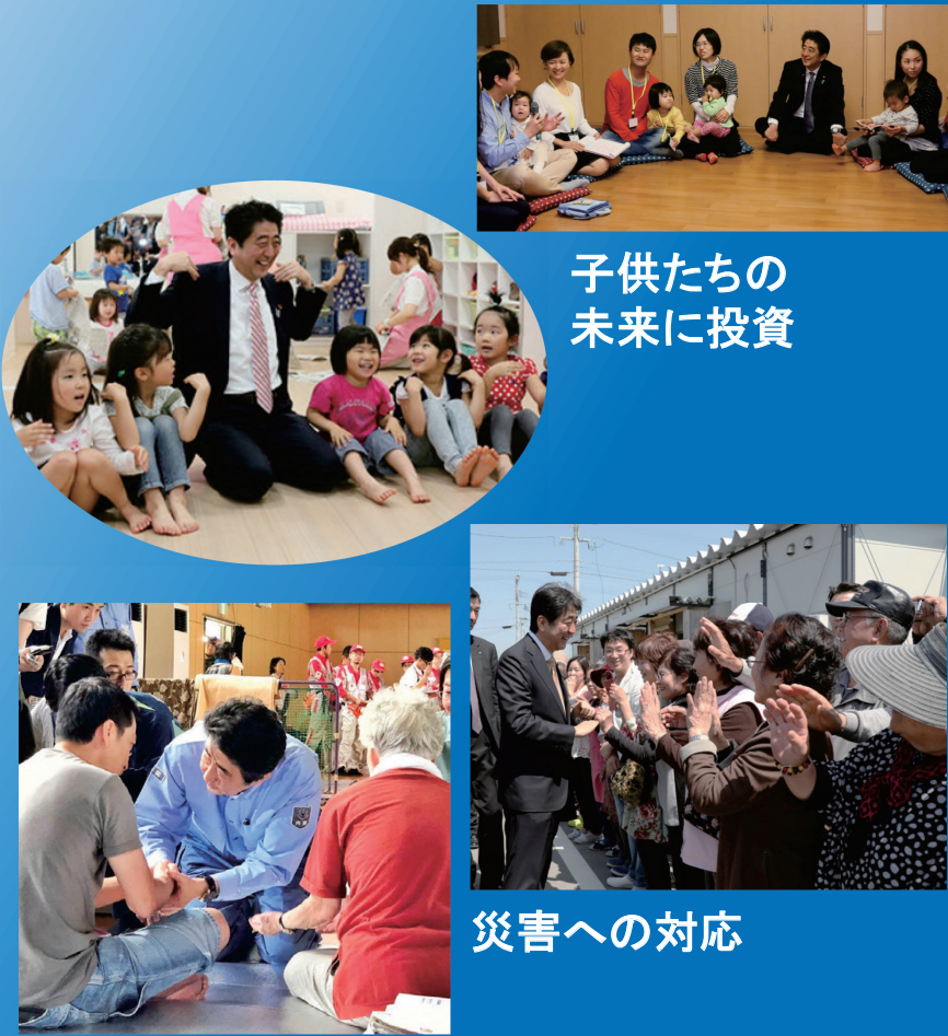
子供たちの 未来に投資